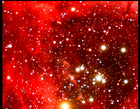
Nebulosa rojiza en la constelación de Monoceros (IMAGEN DEL TELESCOPIO HUBBLE)